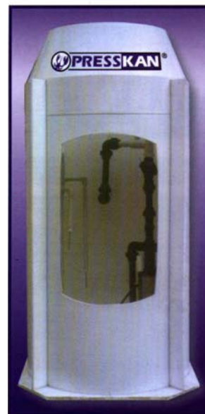
1. Odpadní jímka s technologií

Tento příspěvek by měl částečně být kompenzován minimálním stočným v prvním roce provozu a v dalších letech by stočné nemělo překročit 15 Kč m 3 .