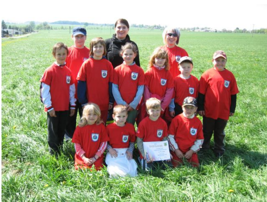
Mladší žáci v Nízké Srbské

Dále bych Vás chtěl pozvat na setkání partnerských obcí (Bohuslavice, Nová Paka a polské Pieszyce) dle projektu „Putování severovýchodními Čechami a Dolním Slezskem bez hranic“ , který je spolufinancován Evropskou unií a je zaměřen na rozvoj cestovního ruchu, jeho oživení, zachování kulturního dědictví v příhraničním území, na zlepšení životních podmínek obyvatel a fungování podnikatelských subjektů. Vychází z potřeby společné integrace, poznávání kultury, tradic a přírodního bohatství. Je to výsledek jednání tří partnerů, které se do projektu zapojili. Roli vedoucího partnera převzaly polské Pieszyce, ostatní obce jsou obcemi partnerskými. Toto setkání se uskuteční v sobotu 25. června na sokolské zahradě v Bohuslavicích, začátek je naplánován na 13 hodin. Zde bude možné mj. zhlédnout vystoupení našich nejmladších hasičů patřících do kategorie přípravky, dále ukázkou požárního útoku, který předvedou mladší žáci a také uvidíte ukázkou historické hasičské techniky.