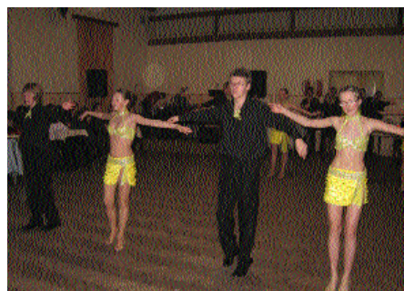
Z hasičského plesu