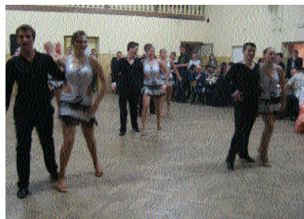
Z hasičského plesu