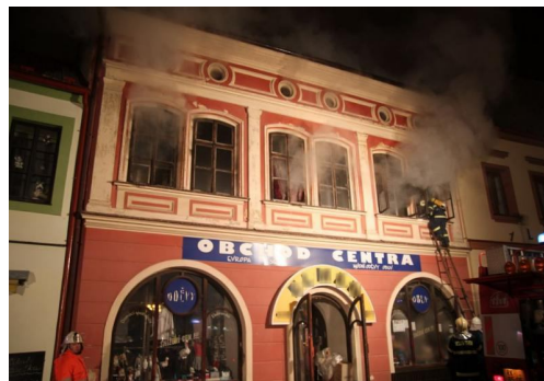
Požár v Dobrušce