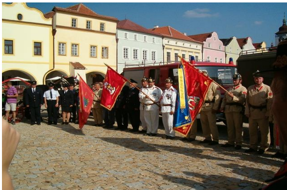
Propagační jízda ze zastávky Nové Město nad Metují

Jelikož jsou už prázdniny za námi a nový školní rok je již v plném proudu, chtěl bych připomenout všem mladým hasičům, že schůzky se opět konají pravidelně každý pátek od 16 hodin. Ať se schůzka bude konat kdekoli (klubovna, tělocvična ZŠ, hřiště atd.) sraz bude vždy u hasičské zbrojnice. Tyto informace neplatí jen pro stávající mladé hasiče, ale také pro všechny ostatní, kteří by se chtěli mladými hasiči stát. Neváhejte a přijďte se kdykoli v pátek podívat.